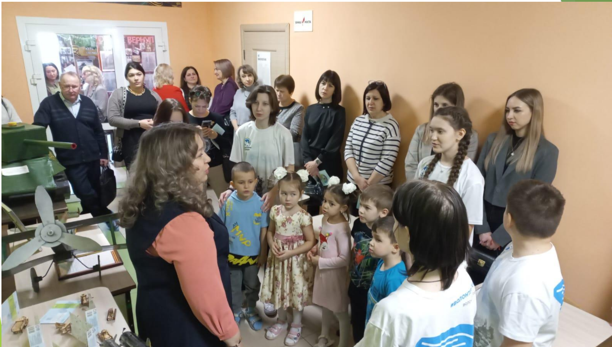
«По страницам Великой Отечественной войны», воспитательное мероприятие патриотической направленности с воспитанниками старшей группы